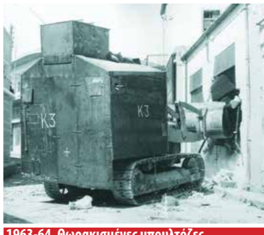
1963-64. Θωρακισμένες μπουλτόζες. Τα ταγκς των ελληνοκυπρίων "αγωνιστών"